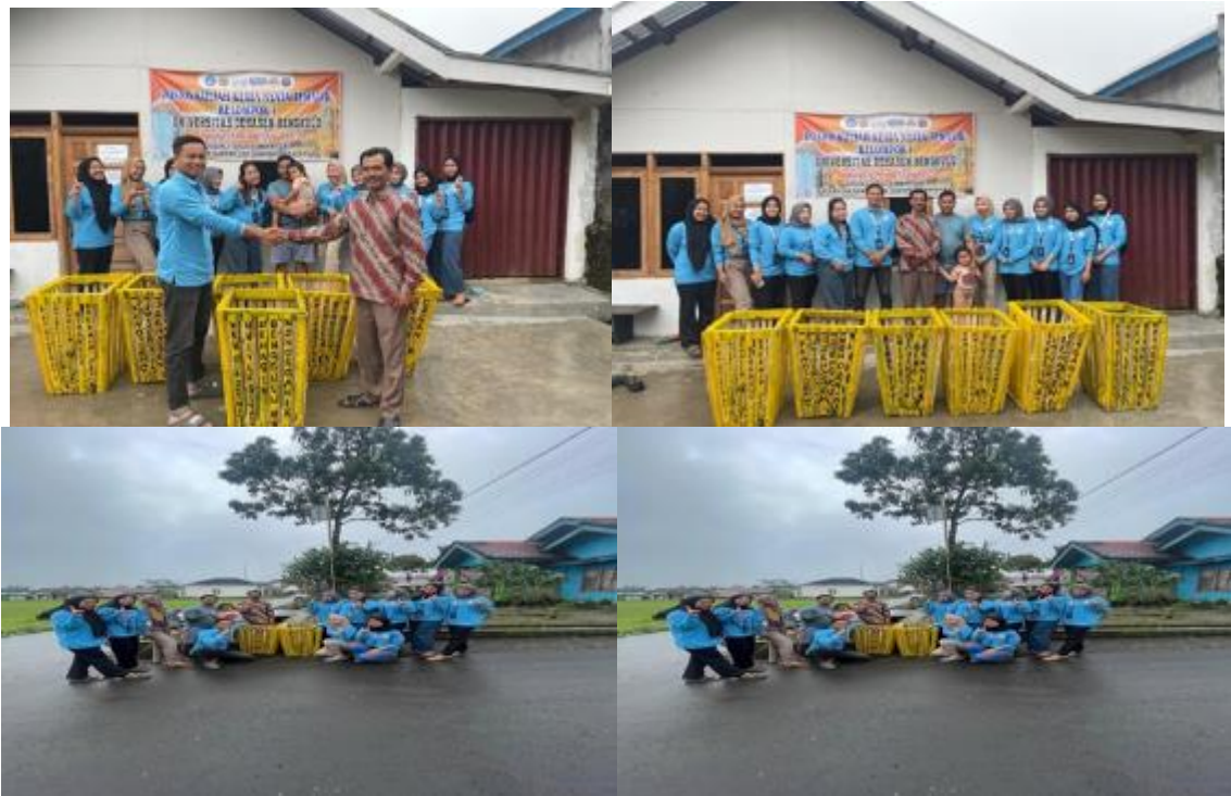
Gambar 3. Kegiatan Gerakan Organik dan Non Organik Lestari (GOKIL)