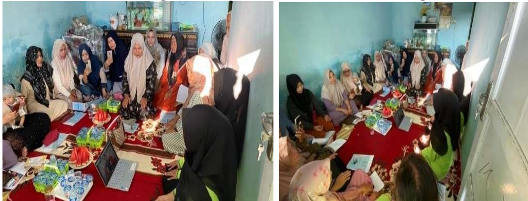
Gambar 3 Kegiatan Terapi Meditasi Relaksasi Otot Progresif