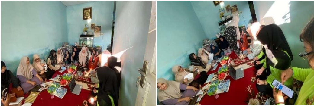
Gambar 3. Kegiatan Terapi Relaksasi Autogenik