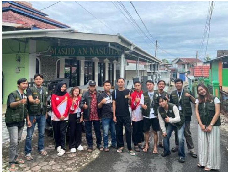
Gambar 2. Kegiatan gotong royong bersama warga RT 08 RW 02

Pemasangan plang edukasi sampah menjadi salah satu inovasi yang memberikan dampak edukatif signifikan. Plang yang dipasang di beberapa titik strategis berisi informasi tentang jangka waktu peruraian berbagai jenis sampah, mulai dari sampah organik yang terurai dalam hitungan minggu hingga sampah plastik yang membutuhkan ratusan tahun untuk terurai. Media edukasi visual ini terbukti efektif dalam meningkatkan kesadaran warga, terutama generasi muda, tentang pentingnya memilah sampah dari sumber. Beberapa warga yang diwawancarai menyatakan bahwa informasi visual tersebut membuka wawasan mereka tentang dampak jangka panjang sampah terhadap lingkungan.