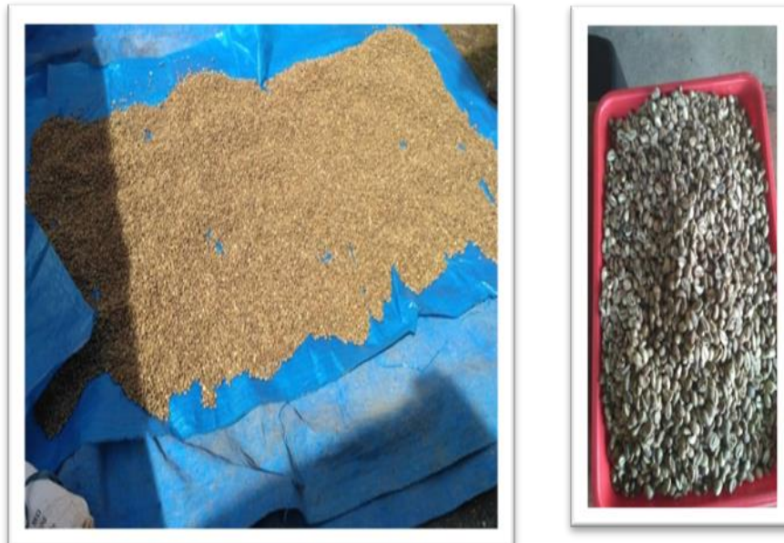
Gambar 1: Bahan Baku Biji Kopi Lokal pilihan

Pemanfaatan Bahan Baku Lokal, Salah satu strategi utama Sengkuang 76 Coffee adalah menggunakan bahan baku lokal. Sengkuang 76 Coffee memprioritaskan biji kopi yang berasal dari daerah Kabupaten Kepahiang, Sengkuang 76 Coffee tidak hanya mengurangi biaya transportasi tetapi juga memperkuat jaringan ekonomi lokal. Selain itu, pemanfaatan biji kopi lokal memberikan identitas unik yang menjadi nilai jual utama produk mereka, yaitu rasa dan aroma khas daerah yang tidak dapat ditemukan di tempat lain. Adapun bahan baku ini didapatkan dari lahan perkebunan kopi di kabupaten Kepahiang terutama di Desa Sengkuang Kecamatan Kabawetan dengan luas sekitar 2 Ha dan Desa Kota Agung sekitar 5 Ha. Jenis Kopi yang dijadikan bahan baku adalah dari jenis kopi robusta dan arabika. Pemanfaatan bahan baku sumber daya lokal tersebut tentunya juga berdampak pada pemanfaatan sumber daya manusia lokal yang secara tidak langsung menyerap tenaga kerja di Kabupaten Kepahiang. Saat ini, pemasaran tradisional kopi arabika meliputi lembaga pemasaran yang terdiri dari petani, tengkulak, pedagang pengumpul, pedagang kecil, pedagang besar, dan konsumen. Pemasaran kopi yang umum dilakukan yaitu saluran pemasaran untuk konsumsi di daerah produksi yaitu untuk pasar eceran lokal dan industri pengolahan di daerah produksi (M. Egitia Zaini, 2024)