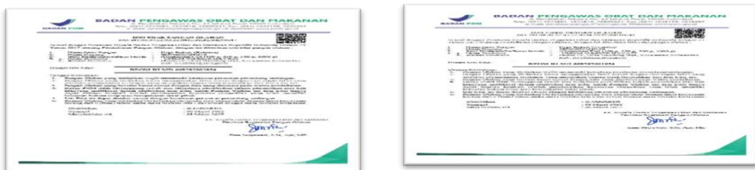
Gambar 4 Sertifikat Bpom Produk Sengkuang 76 Coffee