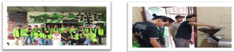
Gambar 3: Edukasi Sengkuang 76 Coffee Kepada Mahasiswa Magang Dari Uiversitas Pat Petulai Rejang Lebong

Edukasi, mengadakan kegiatan edukasi juga dilakukan oleh usaha sengkuang 76 coffee seperti pelatihan menyangrai kopi kepada mahasiswa dan menerima mahasiswa magang di unit sarana milik sengkuang 76 coffee adalah strategi Sengkuang 76 Coffee untuk meningkatkan pemahaman mengenai kopi lokal. Hal ini tidak hanya meningkatkan apresiasi pelanggan terhadap kopi lokal tetapi juga menciptakan loyalitas dan menciptakan jaringan yang lebih luas untuk menyebarkan informasi yang bermanfaat. Edukasi ini menjadikan peserta lebih paham akan nilai unik dari kopi lokal, dan membangun keterikatan dengan merek Sengkuang 76 Coffee. Dalam penelitian lainnya dipaparkan bahwa kegiatan pengolahan kopi mulai dari pemetikan kopi mulai dari pendataan pemetik, tahap pemetikan, tahap pemisahan biji kopi berwarna merah dan hijau, hingga penyerahan hasil petikan, pengolahan biji kopi hingga menjadi bubuk kopi, dan pengemasan serta penyajian kopi, Hal ini merupakan peluang wisata edukasi sekaligus berwisata di alam (Ertien & Leily, 2021).