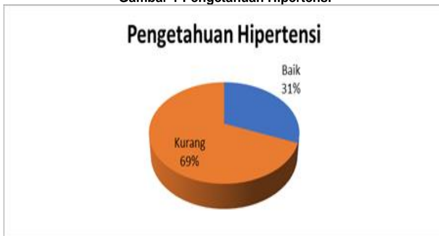
Gambar 1 Pengetahuan Hipertensi

Cara penyajian pada bagian ini dapat dilakukan: 1) pembahasan terpisah dari hasil atau 2) pembahasan menyatu dengan penyajian hasil. Hasil yang dimaksud adalah rangkuman hasil-hasil analisis data, bukan hasil penelitian dalam bentuk data mentah. Hasil analisis data dari software pengolahan data statistik, disajikan dengan mengetik ulang dalam tabel yang disesuaikan dengan kebutuhan, bukan dengan cara meng-copy output hasil analisis . Contoh penyajian data dalam bentuk tabel seperti Tabel 1 Penyuluhan ini dilaksanakan berdasarkan data tingkat pengetahuan masyarakat Desa Pagar gading tentang Tuberculosis (TBC) dan Hipertensi sebagian besar masih kurang. Penyuluhan ini dilakukan pada hari Senin, 01 Juli 2024 di Puskesmas Pagar Gading.