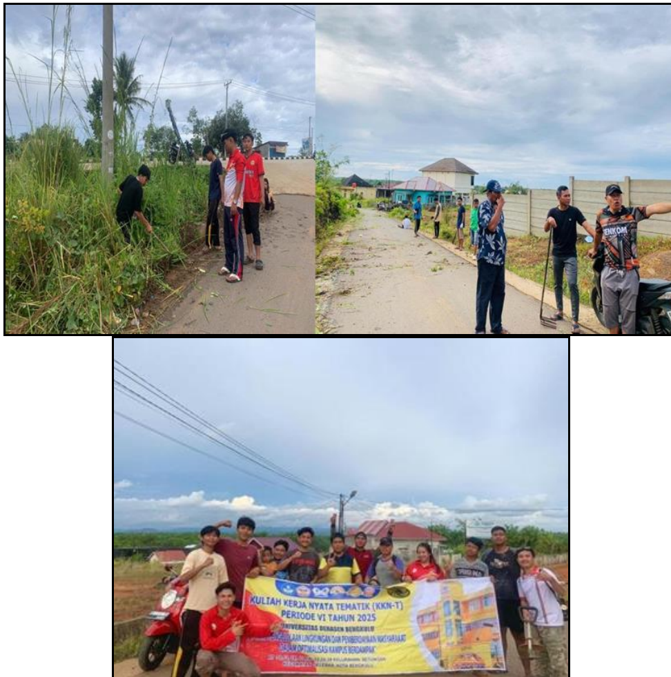
Gambar 2. Aktifitas Gotong Royong Kuliah Kerja Nyata Sampah Rumah Tangga